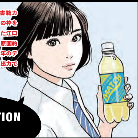
ILLUSTRATION イラストレーション

広告やCDジャケット、書籍カバーなどを通じてマンガの枠をこえて世間に広く浸透した江口ワールド。選りすぐりの原画約200点を展示します。近年のデジタル彩色作品は高精度出力でご覧いただけます。