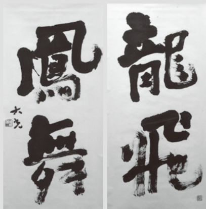
《龍飛鳳舞》 1993年 各 137.0×67.9cm 墨・紙、軸装