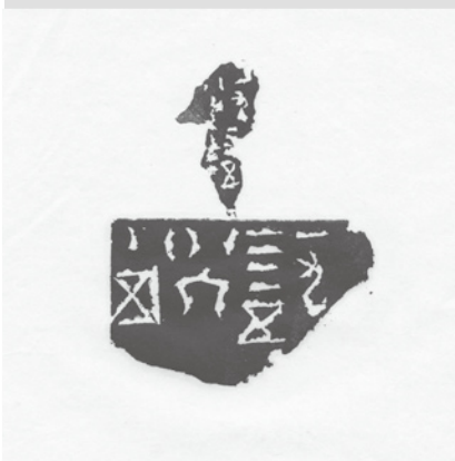
《HIROSHIMA・NAGASAKI》 2006年 31.2×21.8cm 印泥・紙、額装