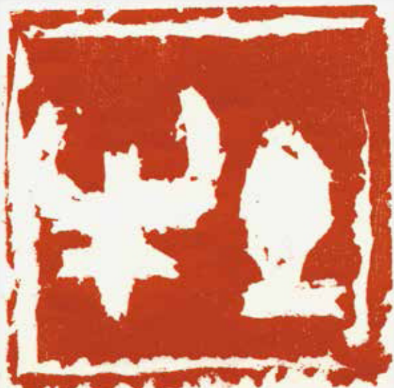
《広島・長崎》(部分) 2006年 各74.9×40.3cm 墨・紙、軸装 《土牛》(部分) 1991年 31.7×22.3cm 印泥・紙、額装