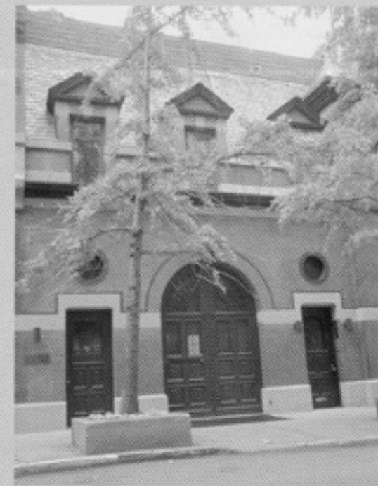
写真:ロスコのスタジオ(現 裏千家ニューヨークセンター)