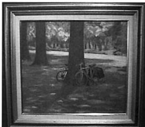
松尾睦子さんの作品<木かげ>