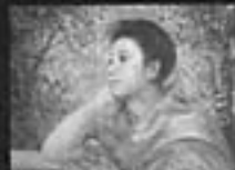
黒田清輝 1909 鹿月堂中土堂美術館蔵