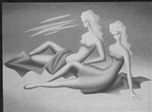
黒田清輝 1905 鹿月堂中土堂美術館蔵

黒田清輝以降、藤島武二、青木繁をはじめとする、近代美術史を彩る多くの芸術家から、戦後の九州派、ネオ・ダダイズム・オルガナイザー、そして現代まで、九州の作家56名をとりあげ、九州・沖縄の大きな美術の力を展望します。