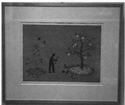
大西靖子さんの作品「夢の中」