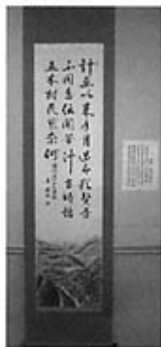
米村政夫さんの作品「情川辺夕曇」