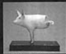
黒田清輝 1904 鹿月堂中土堂美術館蔵