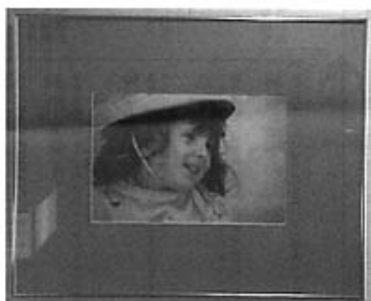
緒方信行さんの作品<祭りの少女>