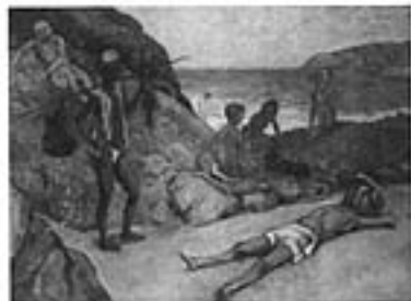
熊本市立美術館蔵