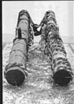
黒田清輝 1905 鹿月堂中土堂美術館蔵